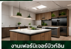
งานเฟอร์นิเจอร์บิวท์อิน