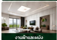
งานฝ้าและผนัง