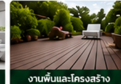
งานพื้นและโครงสร้าง