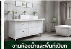
งานห้องน้ำและพื้นที่เปียก